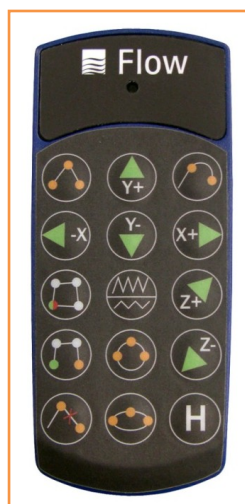
Zdalne sterowanie FlowTeach

Szablon albo element umieszczony jest dowolnie na stole roboczym zbiornika (basenu). Obsługa może teraz nadzorować obrys za pomocą urządzenia LaserPointer lub ewentualnie głowicy cięcia z dyszą miksującą.